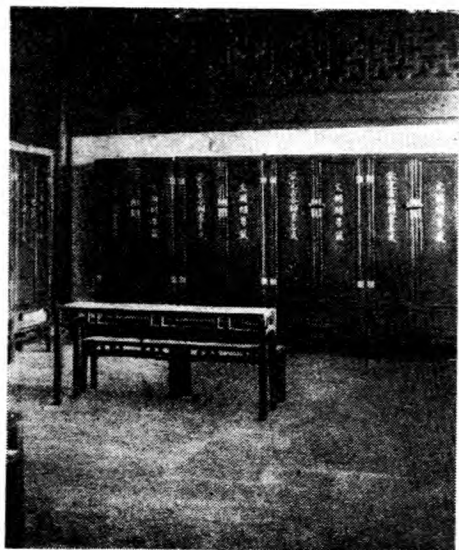
文 瀾 閣

湖，其在仁宗嘉祐四年（一〇五九）所作有美堂記，大爲湖山增重。（有美堂在吳山）後蘇軾守杭州，時題孤山之泉曰六一泉，（在今之俞樓）以表思公之意。蘇軾於哲宗元祐四年（一〇八六）再知杭上，北山始與南屏通」即此之謂。龍井在鳳篁嶺，宋神宗元豐二年（一〇七九）辨才大師自天竺歸老於此，其名大著。師與東坡友善，二人之關係猶如樂天之與韜光。