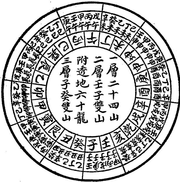
圖雜干附加天後二第