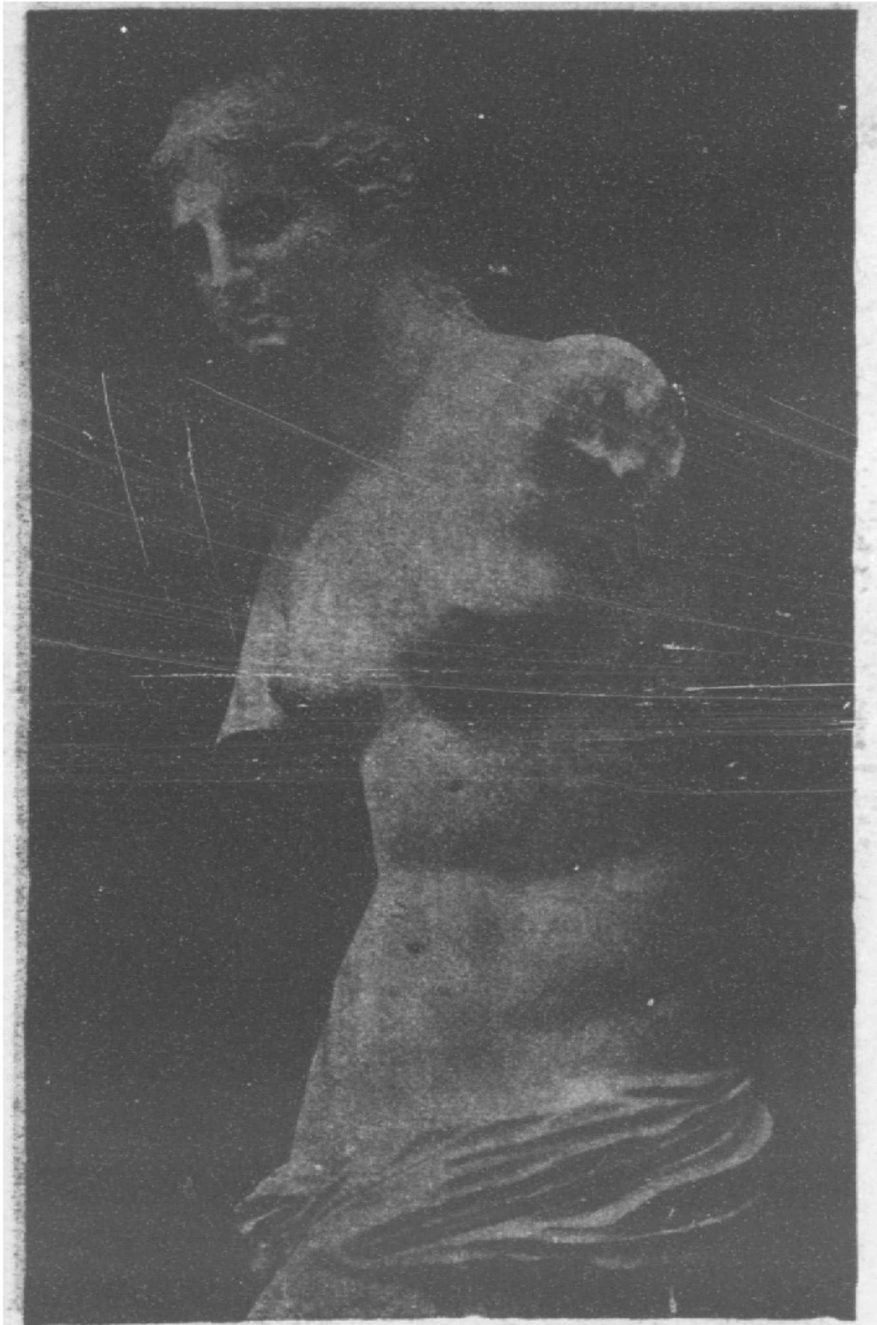
‘彌羅彫像的左側面’ 希臘古彫